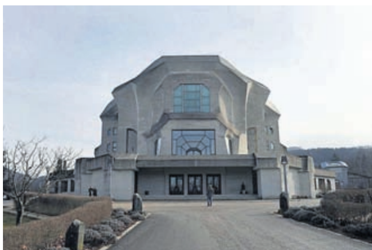
Goetheanum er þekktasta verk Steiners á sviði byggingalistar.